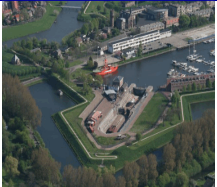
Het bastion met het droogdok

Aan de overkant van het droogdok bevindt zich het bezoekerscentrum