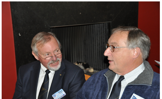
NO wn ZW captains, Freerk nu ook Commodore, volgend jaar jaar is de beurt aan ALbert (links)

niets hoeft te veranderen. Alleen gaan de NO en ZW afdelingen nu squadrons heten, en de eerste mannen daarvan niet meer Commodore, maar Captain. Sneu voor hen, maar zoals wij het inmiddels regelen is elk van hen om beurten tegelijkertijd Commodore. Die positie wordt dan ook tijdens deze ALV overgedra-